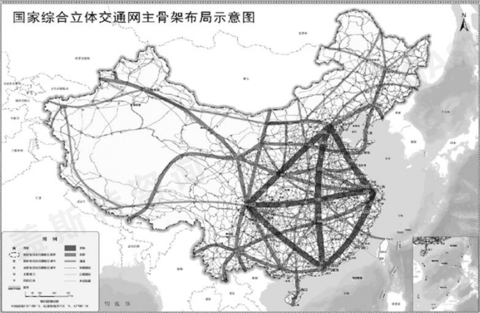
国家综合立体交通网主骨架布局示意图